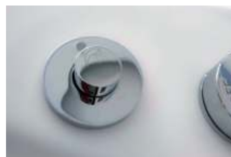
Doccino estraibile Extractable hand shower