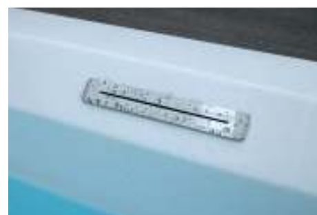
Bocca riempimento vasca a cascata Waterfall fill spout