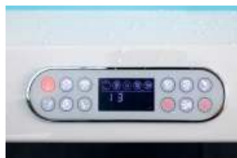
Pannello di controllo LCD Touch retroilluminato Touch backlit LCD control panel